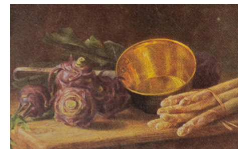
Bild linke Seite oben: Spargelernte, Jungspargel im Auswuchs Bild linke Seite unten: Ernte der Spargelstangen