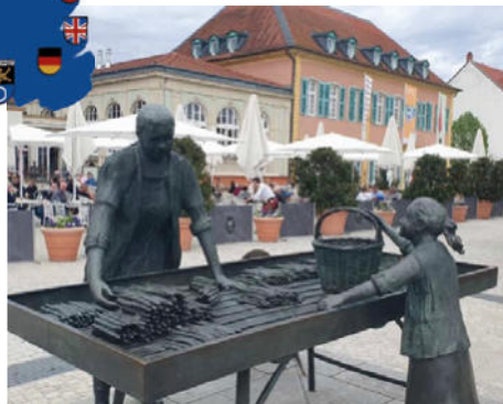
Die Bronze-Skulptur „Spargelverkauf“ von Franz-W. Müller-Steinfurth ist auf dem Marktplatz in Schwetzingen zu finden.

Der Verein Schrobenhausener Städtepartnerschaften e.V. belebt und gestaltet die Beziehungen zu den Partnerstädten Bridgnorth in der Grafschaft Shropshire, Thiers in der Region Auvergne-Rhone-Alpes, Perg in Oberösterreich und Schwetzingen. Die Partnerschaft zu Schwetzingen wurde im Hinblick auf die gemeinsame Verbundenheit zum Spargel beurkundet. Mit großem Engagement Jugend- und Schüleraustauschprogrammen gepflegt, Begegnungen und Veranstaltungen in den Bereichen Kunst und Kultur organisiert und das Verständnis und Verstehen füreinander gefördert. Hier sind im Laufe der Jahre viele Freundschaften entstanden.